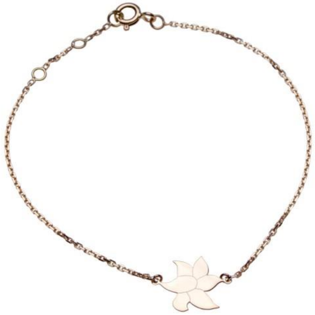
Bracelet " Pétales " en or jaune. www.jezdebugey.com