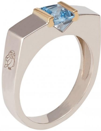
Bague « Moderna Sobriété II » disponible en argent rhodié www.jezdebugey.com