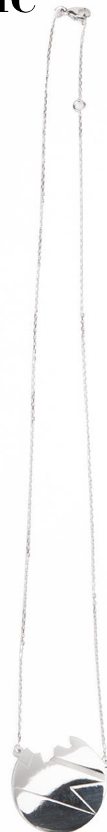
Collier « Lune cassée » Or blanc www.jezdebugey.com