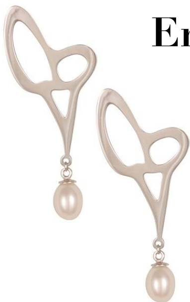
Boucles d'oreilles « Dentelles » disponible en argent www.jezdebugey.com