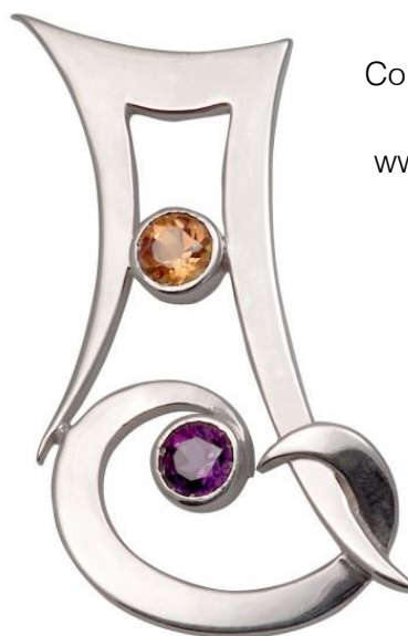
Les formes aériennes donnent à cette broche un caractère contemporain. Vous pouvez aussi la porter comme un pendentif en utilisant l'anneau derrière pour y passer une chaîne, ou bien en glissant un torque derrière l'aiguille. www.jezdebugey.com