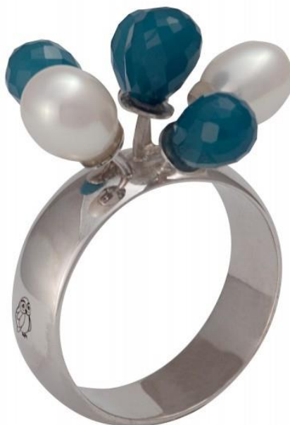
Bague « Dentelles » disponible en argent Anneau plat large et 6 perles goutte de 6,5mm www.jezdebugey.com